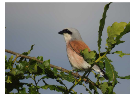
Bilder: Erich Lang, Vögel in und um Buchsi